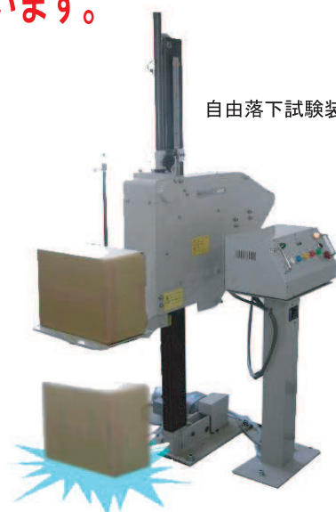
自由落下試験装置