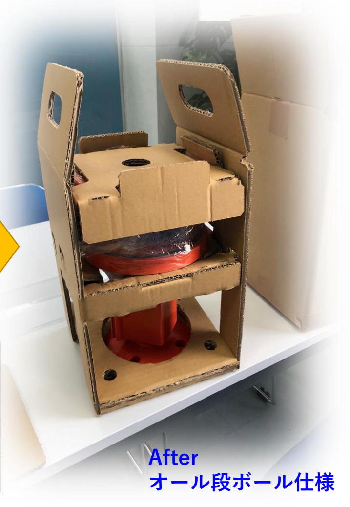
After オール段ボール仕様